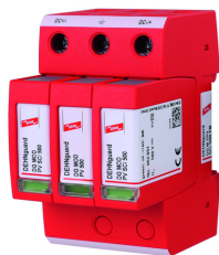
Az ábrák nem kötelező érvényűek