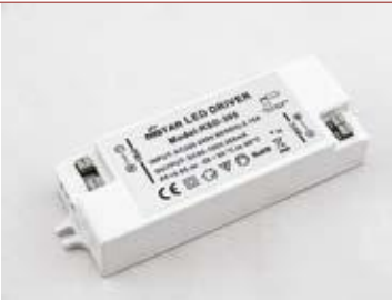
Tápegység / Driver

Rendelési kód /Article number: DEL 1051E