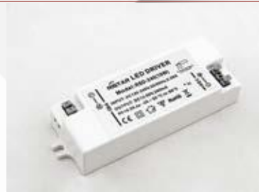
Tápegység / Driver

Rendelési kód /Article number: DEL 1052E