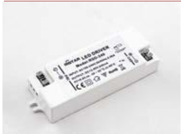
Tápegység / Driver

Rendelési kód /Article number: DEL 1050E