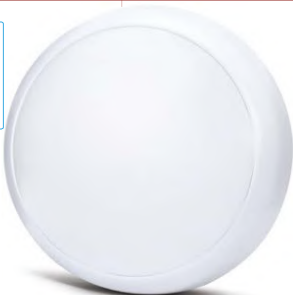
Mozgásérzékelő / Motion sensor